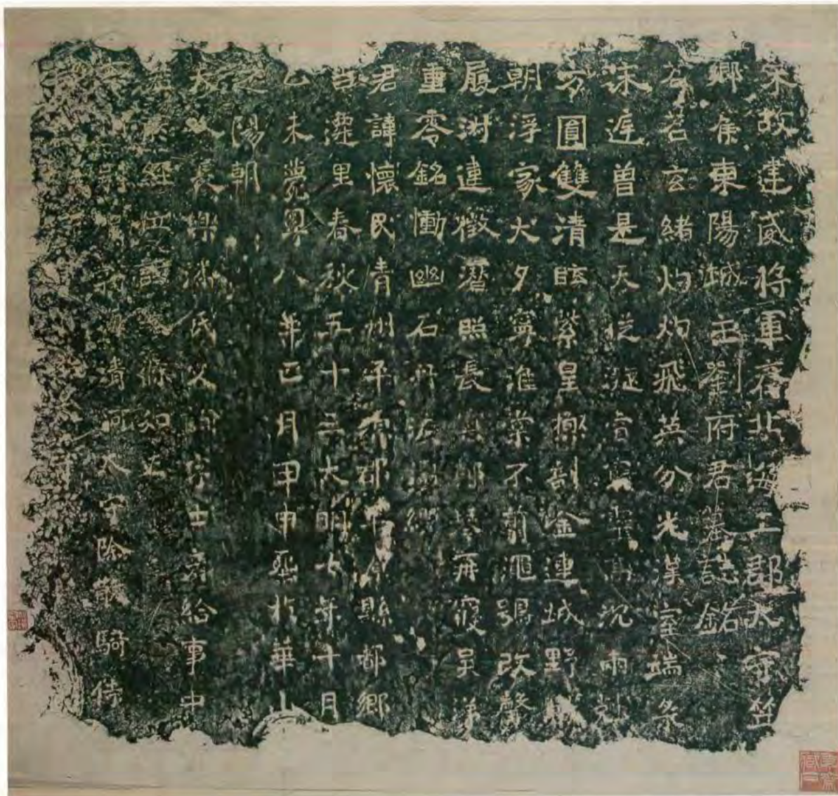
七五 劉懷民墓誌 南朝宋

Figure 2 Epitaph for Liu Huaimin (410–463).